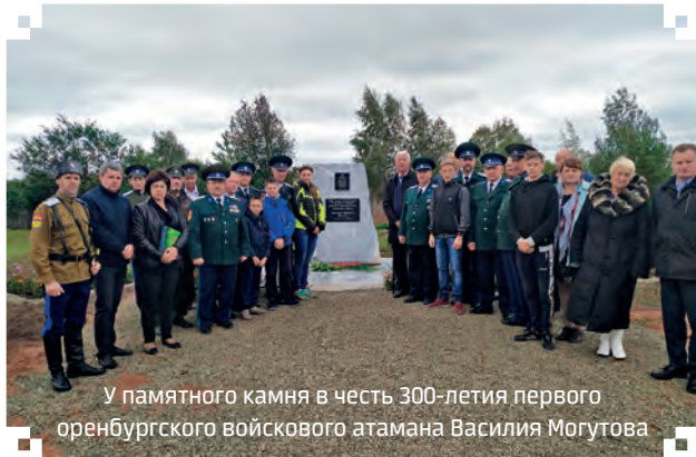
У памятного камня в честь 300-летия первого оренбургского войскового атамана Василия Могутова

10 августа 2019 года казаки станицы «Оренбургская Зимовая» (Представительства Оренбургского войскового казачьего общества в Москве и в Московской области) установили новый памятник на могиле последнего наказного атамана Оренбургского казачьего войска дореволюционной России генерал-лейтенанта Михаила Степановича Тюлина, возглавлявшего войско в 1915-1917 годах.