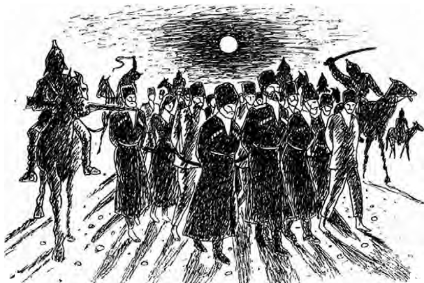
Ю. Семенов. Рисунок из книги А. Орлова «Военное детство»

В 2019 году исполнилось 100 лет трагическим событиям 1919 года, которые оставили глубокие шрамы в истории российского казачества. Рассказыванием историки называют политику большевиков, которая заключалась в лишении казаков политических, военных прав, ликвидации казаков как социальной, культурной общности.