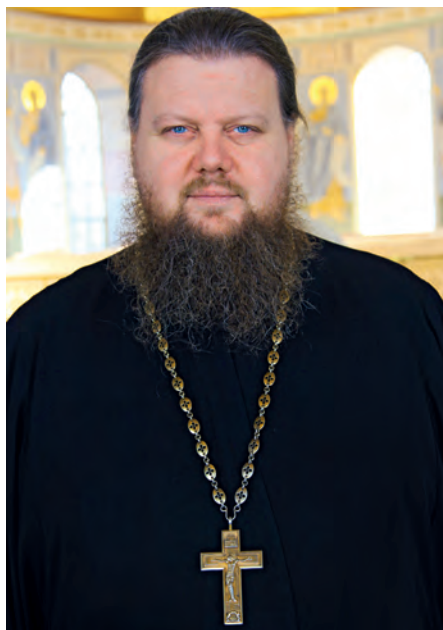
Господа атаманы, братья казаки!

Без памяти об исторических событиях, об уроках прошедших столетий в обществе не будет духовных и нравственных ориентиров. Равно как и без духовно-нравственных ценностей, которые должны составлять фундамент личности любого представителя казачества, бессмысленными станут и глубокие знания в области истории. Поэтому считаю важным и значимым событием выпуск первого войскового журнала Оренбургского Войскового Казачьего Общества. Надеюсь, журнал при вашем активном участии станет особым общественным инструментом, который сможет содействовать духовному развитию казаков, содействовать осознанному принятию ими общественных ценностей, сложившихся в казачестве, и поможет выбрать истинные ориентиры в решении сложных нравственных проблем в соответствии с образцами и идеалами Русской Православной Церкви.