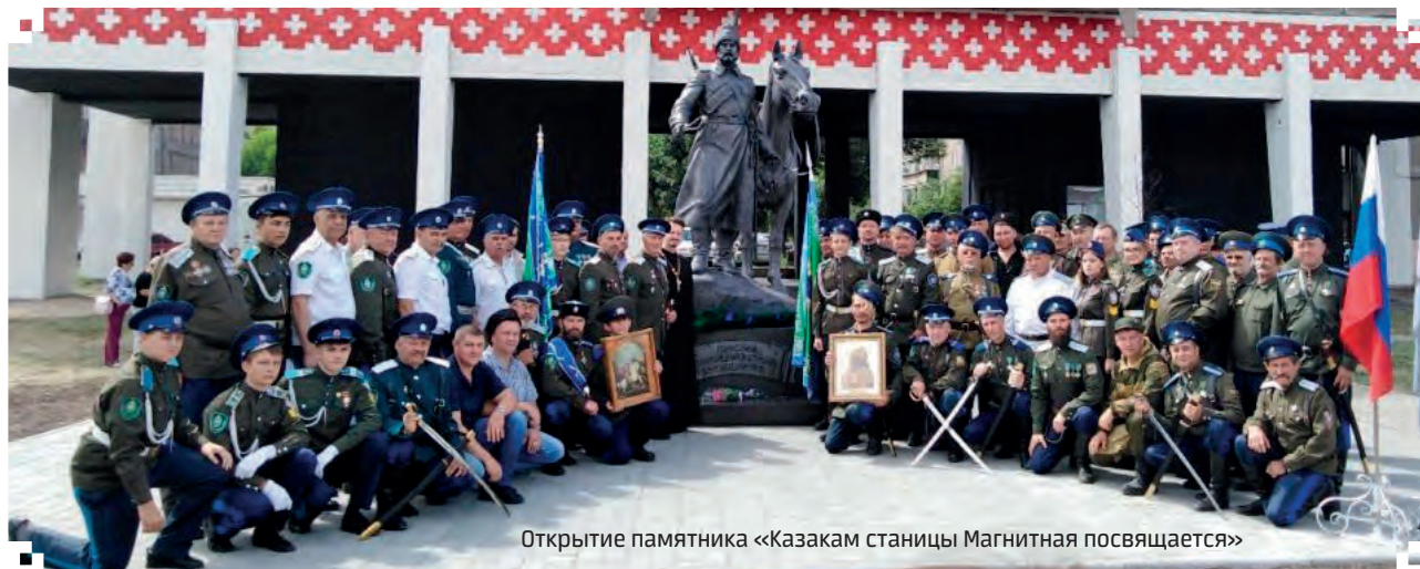
Открытие памятника «Казакам станицы Магнитная посвящается»

В 1745 году по приказу губернатора Ивана Ивановича Неплюева казаками Исетского войска была заложена Нижнеуральская крепость, от основания которой ведет свою летопись Южноуральск.