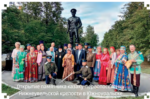
Открытие памятника казаку-первопоселенцу Нижнеуральской крепости в Южноуральске

Иванович Неплюев. Возвращаясь из Шадринска вдоль рек Уя и Урал, он провел инспекцию существующих крепостей, а также заложил по пути следования новые. Тогда им был оставлен опорный пункт в районе горы Магнитной-Атач.